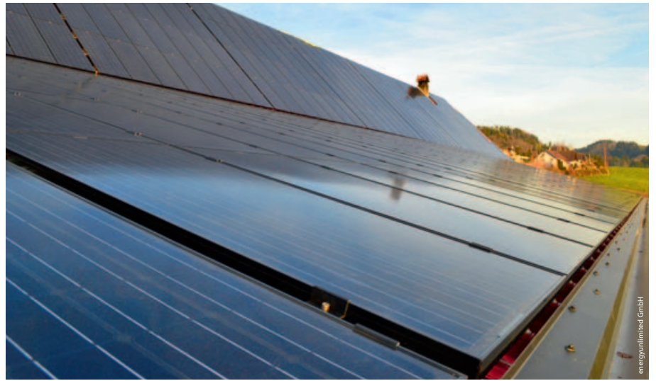
Realisierte Anlage auf Bauernhausdach von Andreas Riesen, Oberscherli

«Die Photovoltaik ist eine gute Kapitalanlage, wenn die kostendeckende Einspeisevergütung (KEV) ausgelöst werden kann.»